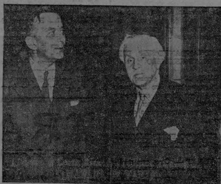
George Bedault, ministro de relaciones exteriores de Francia, (izq.), y Paul Boncour, ex presidente de la cámara de diputados, dos de los delegados franceses a la conferencia de las Naciones Unidas, son fotografiados a su llegada al aeropuerto de San Francisco.

¿Quiere disfrutar de un rato realmente alegre y feliz?