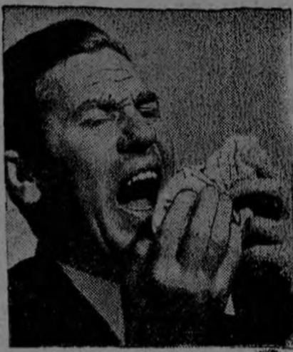
"El dolor mata, las Pastillas LUZ matan el dolor".