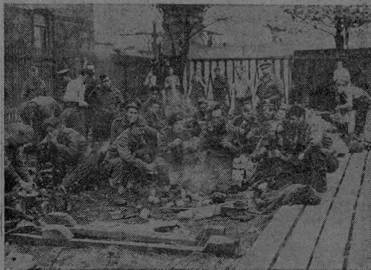
Soldados británicos, algunos de los cuales llevaban cinco años prisioneros, fueron liberados al capturar el noveno ejército norteamericano la ciudad de Brunswick. He aquí el momento en que los ex prisioneros tomaron su primera comida fuera de la vigilancia opresiva de los guardas alemanes.